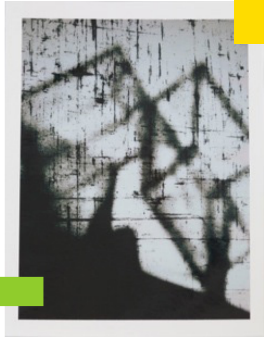
Miranda Lichtenstein, "Polaroids", New York #6, 2014